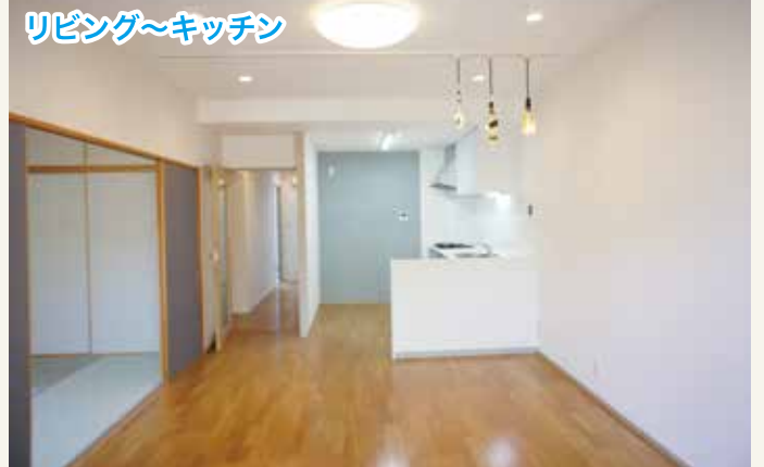
リビング~キッチン

調光式シーリングライトとダウンライトとの組合せで、 昼間は明るく、夜は、ムーディーに