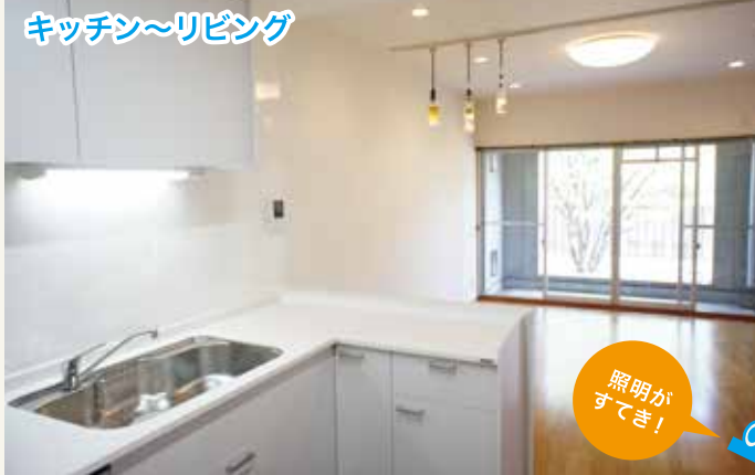
キッチン~リビング

JR学研都市線 東寝屋川駅 徒歩12分 交野市星田西4丁目1-9コモンシティ星田アステージ9棟 205号室