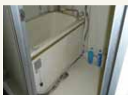
洗濯機の排水がお風呂の中に