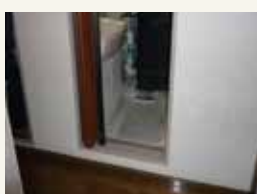
洗面・脱衣場に扉がなく、カーテン。廊下からの段差も大きい