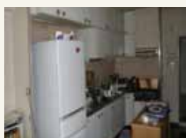
キッチンが、リビングから丸見え