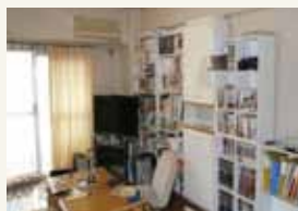
狭くて暗いリビングルーム